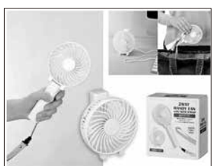
ネックストラップ付き2WAY ハンディファン