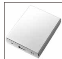
モバイルバッテリー 乾電池式